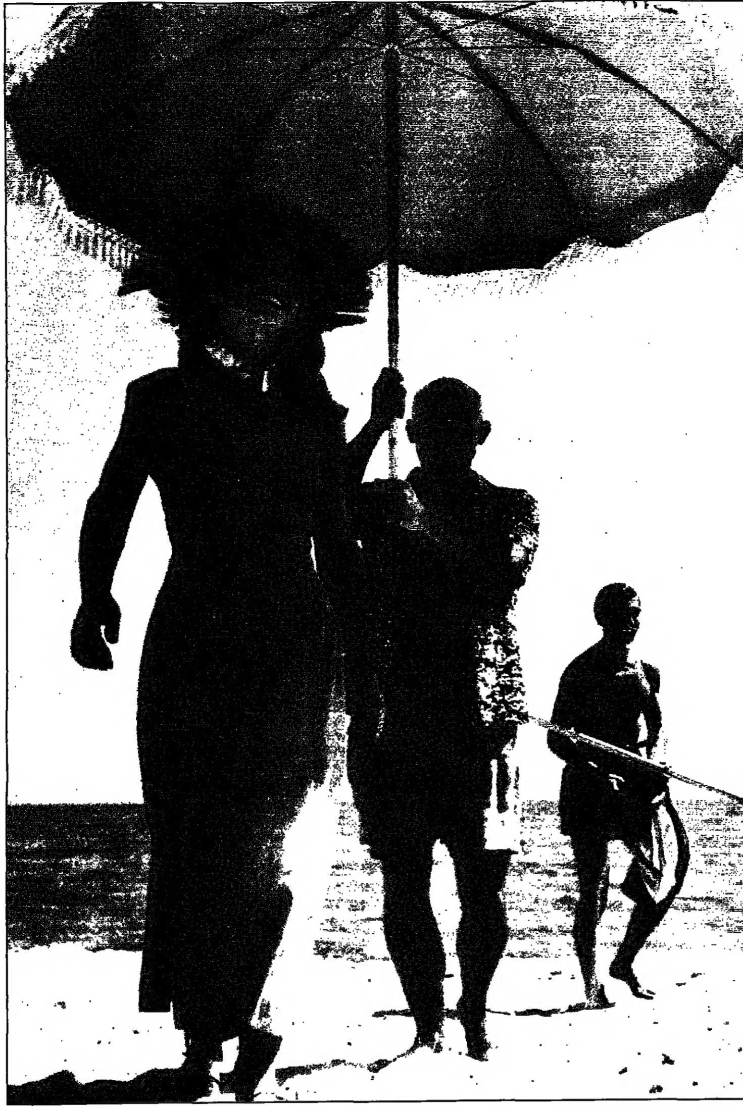
فرانسواز جيلو مع بيكاسو في شبهايا

من هي فرانسواز جيلو لتلكم هكذا؟ انها رفيقة بيكاسو طيلة ستة اعوام وانجبت منه بنتا بالوما وابنا كلود. واليوم، وبعد ان اجتاح فيلم جيمس إيورني